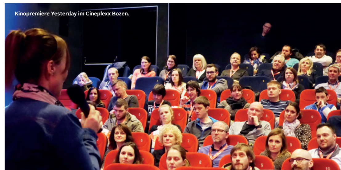
Kinopremiere Yesterday im Cineplexx Bozen.