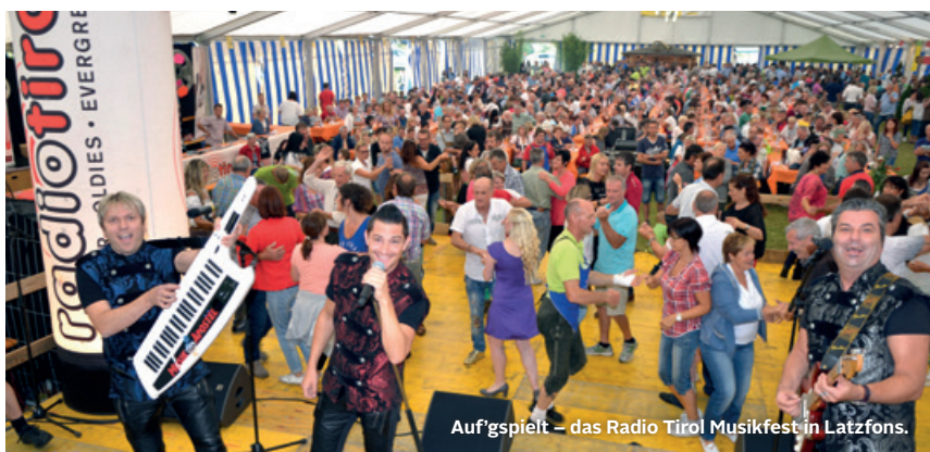
Aufgspielt – das Radio Tirol Musikfest in Latzfons.